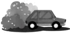
Les véhicules motorisés