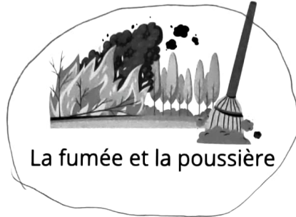
La fumée et la poussière