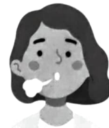
Les êtres vivants